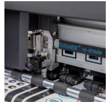
Área de corte