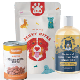
Cuidado y alimentos animales