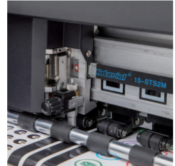
Área de corte