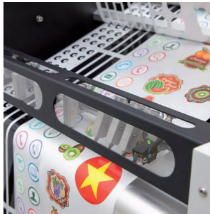
Sistema de corte longitudinal con corrección de borde