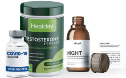
Salud, medicinas y nutrición