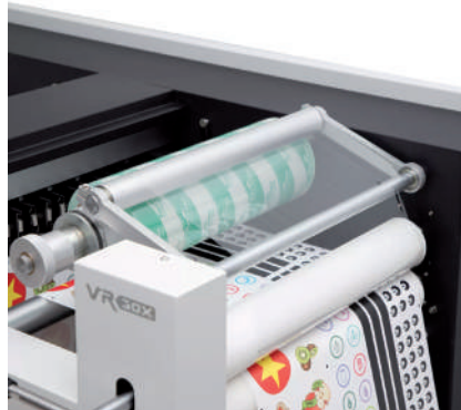
Sistema de laminado