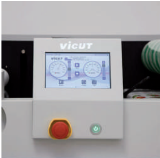
Pantalla táctil de 7"