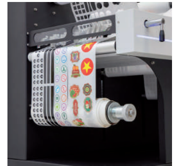
Sistema de rebobinado automático