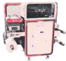
ArrowJet Aqua 330 R