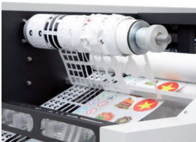
Sistema de tensión y eliminación de residuos