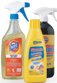
Productos de limpieza del hogar