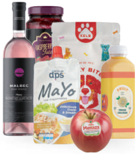
Alimentos y bebidas refrigeradas