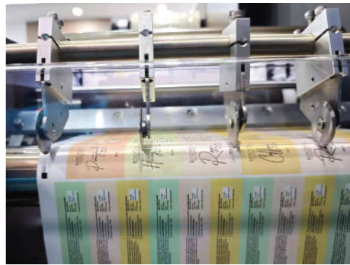
cuchillas de separación longitudinal