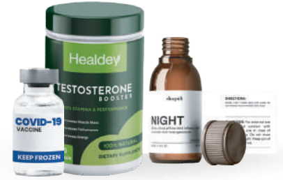
Salud, medicinas y nutrición