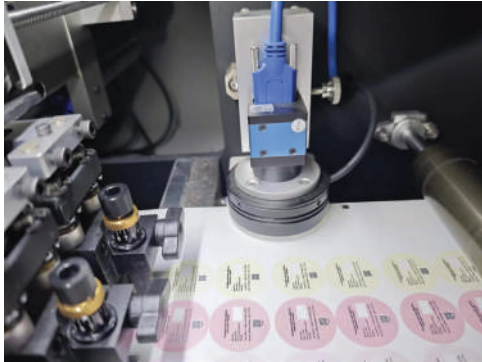
Lector óptico de alimneacióm con cámara CCD