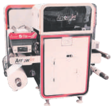
ArrowJet Aqua 330 R