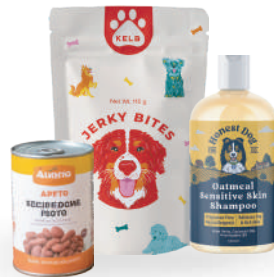
Cuidado y alimentos animales