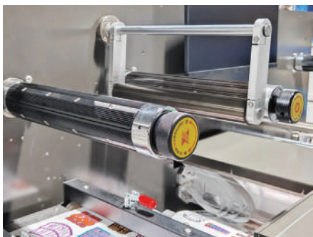
Materiales de grado insutrial