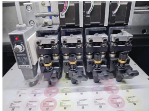
4 Cabezales de corte y máximo 8