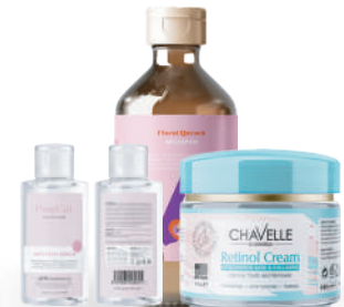
Productos de cuidado personal