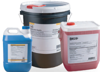
Etiquetado reglamentario para Químicos