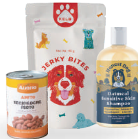
Cuidado y alimentos animales