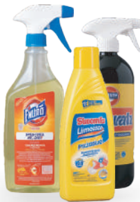
Productos de limpieza del hogar