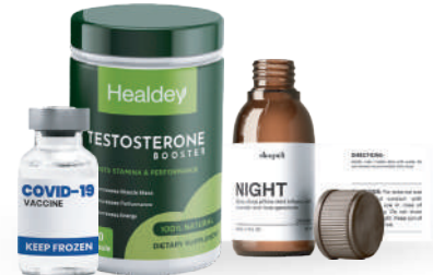
Salud, medicinas y nutrición