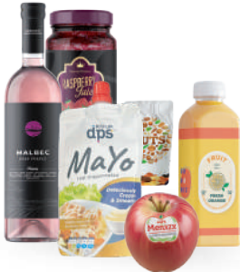
Alimentos y bebidas refrigeradas