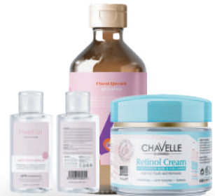
Productos de cuidado personal