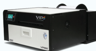
VIP Color 610-660