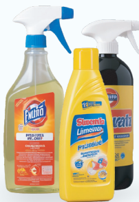
Productos de limpieza del hogar