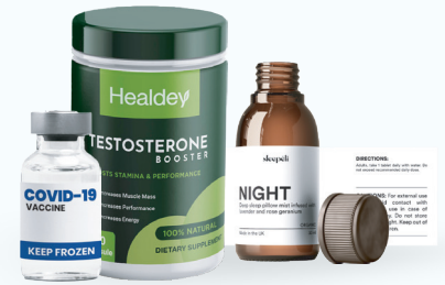
Salud, medicinas y nutrición