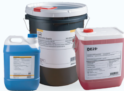
Etiquetado reglamentario para Químicos