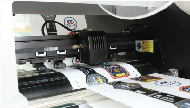
Sensor óptico: escaneo avanzado que permite un corte exacto