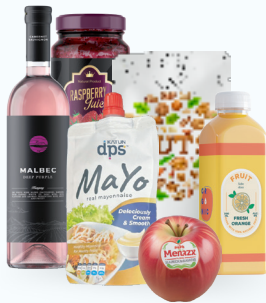
Alimentos y bebidas refrigeradas