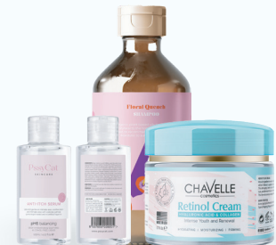
Productos de cuidado personal