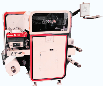
ArrowJet Aqua 330 R