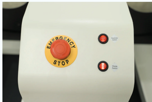
Sistema de posicionamiento a través de marca de registro