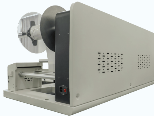
Material de construcción grado industrial