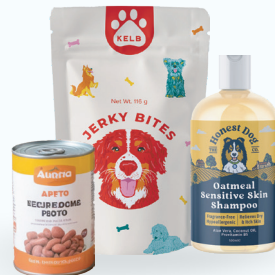
Cuidado y alimentos animales