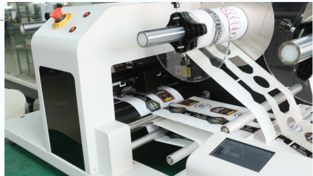
Rebobinador de matriz excedente