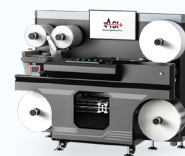
EzCut 350 RX