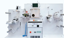
Taurus 35 PL Cortadora láser