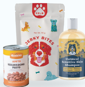
Cuidado y alimentos animales