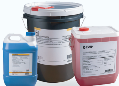
Etiquetado reglamentario para Químicos