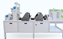
Scorpio 35 X2