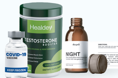
Salud, medicinas y nutrición