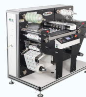
EzCut 330 RX