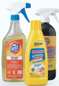
Productos de limpieza del hogar