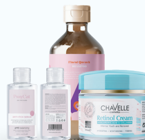
Productos de cuidado personal