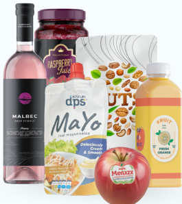
Alimentos y bebidas refrigeradas