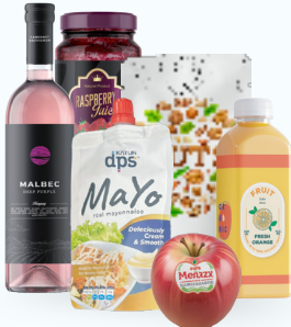
Alimentos y bebidas refrigeradas