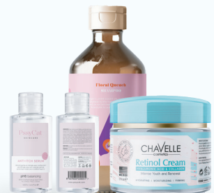
Productos de cuidado personal