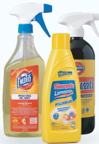
Productos de limpieza del hogar