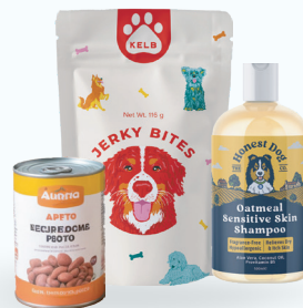
Cuidado y alimentos animales