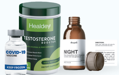
Salud, medicinas y nutrición