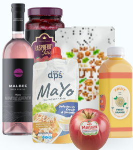
Alimentos y bebidas refrigeradas