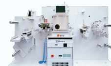
Taurus 35 PL Cortadora láser