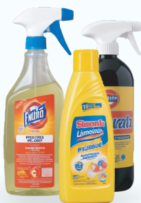
Productos de limpieza del hogar