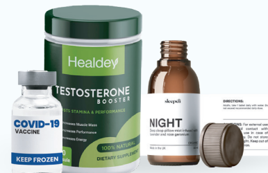
Salud, medicinas y nutrición